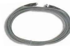
延長コード(5~300m)中継コネクタ付 ※ファクトリオプション

※ファクトリオプションはご注文を頂いてから製造元で校正作業などを行いますのでお時間をいただく場合があります