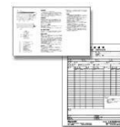
使用法・検査成績表